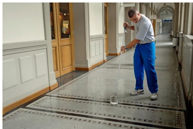
2 Vom Baugewerbe in den Betriebsunterhalt